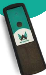
Opcionális (választható): EMP detektor/ érezékelő