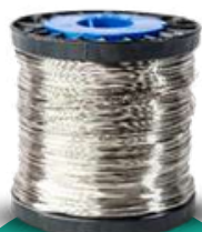
385 méter 22-es vastagságú rozsdamentes acélhuzal (316-os minőség)