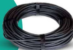
25 méter szigetelt kábel