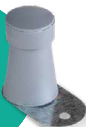
100 darab jeladó