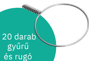
20 darab gyűrű és rugó